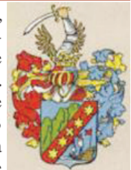
Blazonul familiei Capdebo